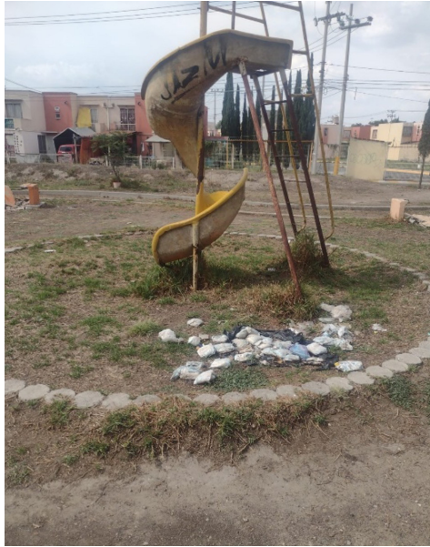
Figura 2. Área de juegos infantiles