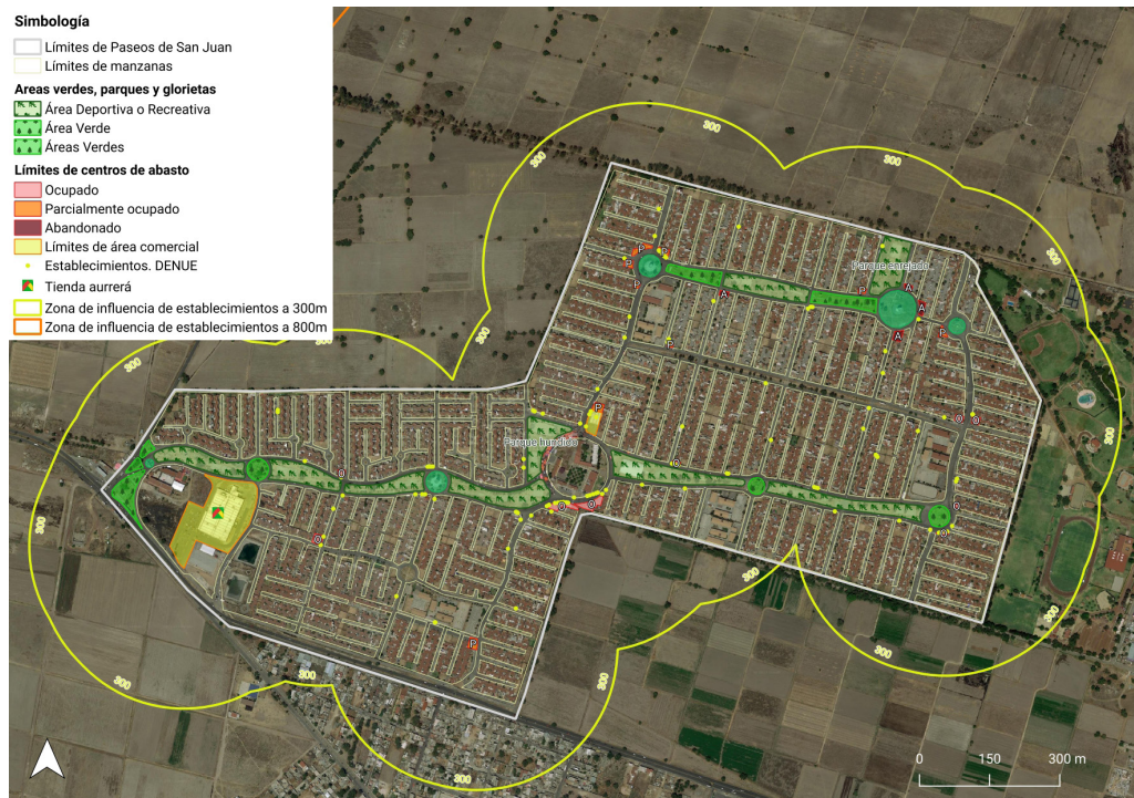
Figura 4. Centros de abasto y área comercial