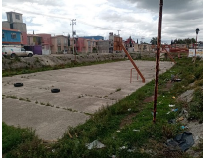
Figura 3. Parque Hundido